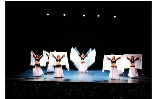
Gala du 6 juin 2009

Comme toute autre danse, la danse orientale est un art vivant qui s'exprime sur scène. Nous travaillons donc à créer des chorégraphies de qualité.